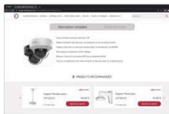
Une navigation intelligente