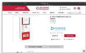
Un design simple, ergonomique et responsive