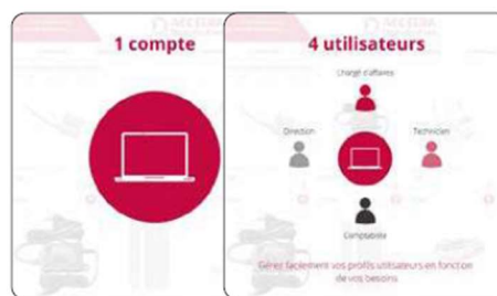
Un seul compte client, 4 utilisateurs