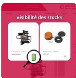
Les stocks en temps réel